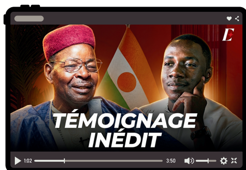
S.E. Mahamane Ousmane

La crédibilité d'un programme se mesure, avant tout, à la qualité des voix qui acceptent d'y prendre la parole. En moins d'un an, le plateau d'Excellence a accueilli des figures dont le parcours fait référence, au Niger comme à l'international.